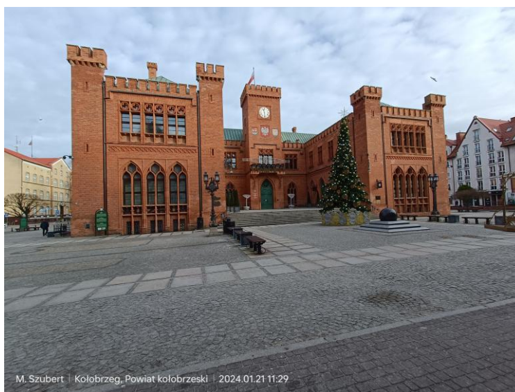
Fot. 1. Dworzec kolejowy w Kołobrzegu (fotografia własna lub podać źródło np. http:// ..... )

Uwaga: Ilustracje po wstawieniu do tekstu muszą być ustawione względem tekstu z wykorzystaniem położenia/zawijaj tekst. Narzędzie odstępnie jest po wstawieniu ilustracji i pojawia się w jej prawym górnym narożniku lub po zaznaczeniu ilustracji Układ lub Format obrazu/Położenie/Zawijaj tekst.